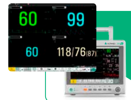
Múltiplas visualizações de tela e com teclas de atalho customizáveis