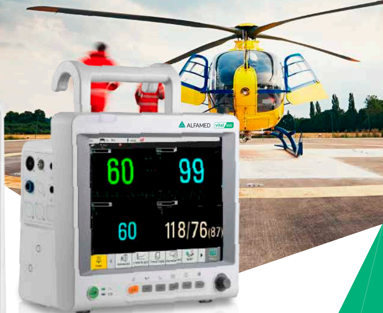
Múltiplas visualizações de tela e teclas de atalho configuráveis