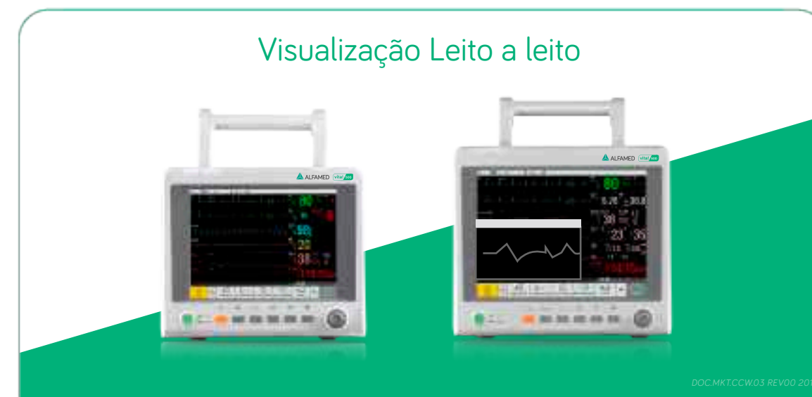
Visualização Leito a leito