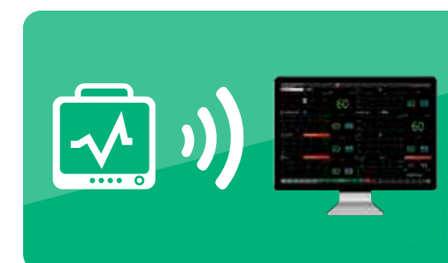
Conexão bidirecional com Central de Monitoramento Clique aqui