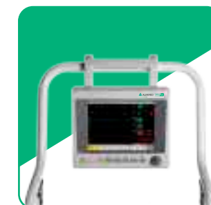
Alça flexível e retrátil para suporte em diferentes macas e camas hospitalares