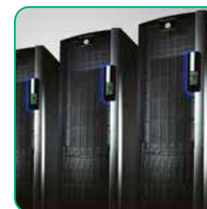
Fácil conexão HL7 / HIS