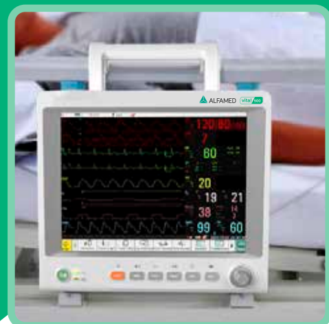
Alça para maca