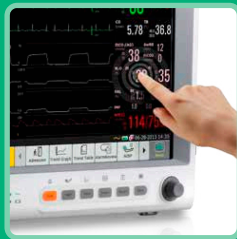
Tela touchscreen de 10.4" ou 12.1"

Os monitores VITA 500 series são indicados para pacientes de média e alta acuidade e que precisam de um monitoramento confiável, mesmo durante o transporte.