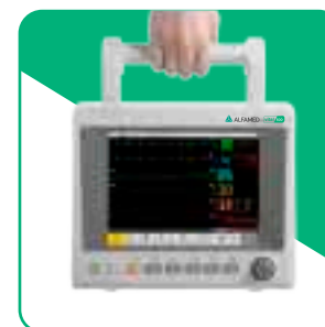
Leve e Compacto

Durante os atendimentos emergenciais ou durante o transporte interno e externo de pacientes críticos, a qualidade do sinal vital e o manuseio do equipamento realmente importa. Os monitores VITA 500 foram desenvolvidos para essa finalidade.